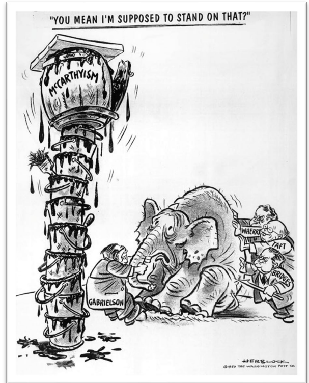
Herbert Block's cartoon in Washington Post on March 29, 1950

On March 9, 1954, news broadcaster Edward R. Murrow dedicated his entire evening program, See It Now , to condemning McCarthyism and actions taken by the senator. As one of the most trusted journalists in the country, the broadcast drew increased public attention to Senator McCarthy's tactics. In the days following the broadcast, due to growing factual disputes and claims of bias, the other PSI members voted unanimously to remove Senator McCarthy as