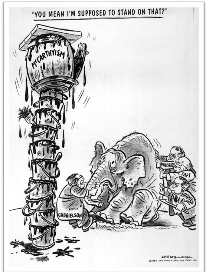
Caricatura de Herbert Block en el Washington Post el 29 de marzo de 1950

El 9 de marzo de 1954, el presentador de noticias Edward R. Murrow dedicó todo el programa nocturno See It Now a