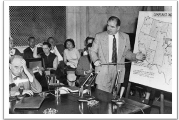
El abogado Joe Welch y el senador Joe McCarthy en las audiencias Ejército-McCarthy el 9 de junio de 1954

Las audiencias Ejército-McCarthy empezaron el 22 de abril de 1954 y se extendieron a 35 días. Durante su emisión, los programas alcanzaron una enorme audiencia cercana a los 20 millones. A pesar de perder su puesto en PSI, el senador McCarthy utilizó una variedad de tácticas para dominar las audiencias, incluso abusando de normas institucionales del Senado. Él testificó en partes de seis días y acudió a todas las audiencias, usando su estatus como senador para interrumpir a múltiples testigos al señalar “ cuestión de orden ”, lo que se convirtió en un eslogan en todo el país. Las audiencias fueron para muchos estadounidenses el primer contacto directo con la conducta del senador McCarthy, y muchos se sorprendieron cuando trató de introducir fotografías y documentos manipulados en el expediente, así como intimidar a testigos y hacer acusaciones infundadas.