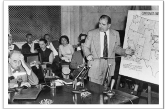
Attorney Joe Welch and Senator Joe McCarthy at the Army-McCarthy hearings on June 9, 1954

The hearings ended on June 17, 1954, and the report cleared the Army of wrongdoing while noting that the Army should have brought complaints to the full subcommittee when officials felt Senator McCarthy and staff requests had become unreasonable.